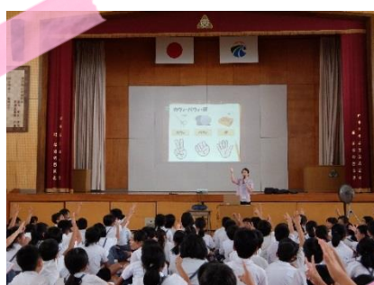
国分西小学校での初めての出前講座

霧島で約2年間、仕事の面でも生活の面でも色んなことを学び、感じました。初めて小学校での出前講座の時、すごどきどきした記憶が鮮明に残っています。それも100人近くの小学生の前でした。子供たちの目線で韓国を紹介することが難しいこともありましたが、いつも子供たちはキラキラした目で正直で純粋に伝えてくれました。子供たちとの交流はいつも楽しみでした。最近はK-POPが好きな学生など、韓国に興味がある方にも会う機会が多くあり、たくさん話しかけてもらえるので、まるで有名人になったような気持ちになることもありました。