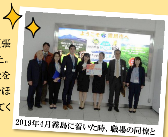
2019年4月霧島に着いた時、職場の同僚と

誰に道を聞いても一緒に行ってくれるような優しい人やどんな仕事でも頑張るアルバイトの人などを見て、心の中で日本で住んでみたいと思いました。大学の卒業頃、日本の方々と身近で交流できる国際交流員ということを知って「これだ！」と思って志願しました。大学生の時は日本で住むことをほぼ断念していましたが、日本の方との色んな出会いがここ霧島まで導いてくれたと思います。