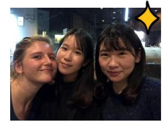
仲良しのアメリカ・中国の交流員と

それでも、霧島に来て一番よかったのは色々な人々と交流し、良い友達がたくさんできたことです。まずは霧島市で会ったアメリカ、中国の国際交流員の友達は本当に親友になりました。慣れない一人での生活をお互い手伝い、話しながら頑張ることができました。また、何でも聞いてくれる家族のような職場の方やプライベートで親くなった友達など本当にありがたいです。皆さんのおかげで霧島に来る前と比べ、自分に自信ができました。これからもこの縁を大事にしていきたいです。