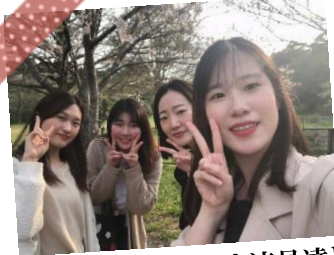
鹿児島県内の国際交流員達と

霧島からたくさんのお話をもらって、これから韓国での新しい挑戦を始める力をもらいました！私は霧島に来て文化芸術の業界で仕事をしたいという思いが強くなって、これから韓国で経験を積んでいきたいと思っています。