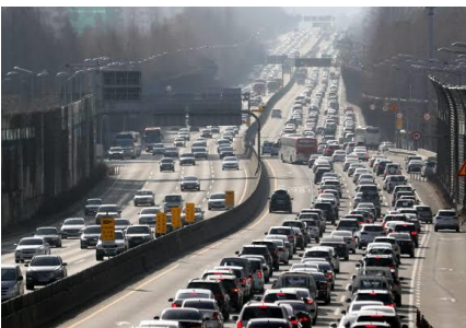
実家に帰ろうとする車たち

もう一つは、親戚のお節介です。学生は成績や将来のことを、成人になったら就職や結婚のことを言われます。そのせいで、実家に帰らない人も出てきたこともあります。最近はそのようなお節介は減っています。