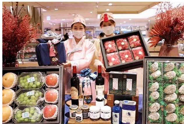
デパートで売っているプレゼントセット

「ソルナル」の時に久々に会った親戚や日ごろお世話になった人たちにプレゼントをあげる風習があります。そのため、「ソルナル」が近い月からデパートや大型スーパーではサラダ油セットやスパムセットなど、生活に必要とされるものをセット商品で売っています。プレゼントするのは生活用品以外にも家電製品や商品券など、様々なものをプレゼントします。なので、特別セールや多様なイベントが行われます。