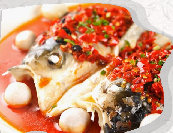
剁椒魚頭 (ドゥオジャオユートウ)

湖南料理は湘菜と称され、中国の八大料理の一つです。その激辛の味付けで中国全土に愛されています。代表的な料理には辛味の強いトウガラシが入っている剁椒魚頭や、豆腐を発酵させて作った臭みのある臭豆腐などがあります。これらの料理は唐辛子やニンニクを多用し、強い味付けが特徴です。湖南省の料理は新鮮な魚や野菜など、地元の食材を活かした料理が多いです。