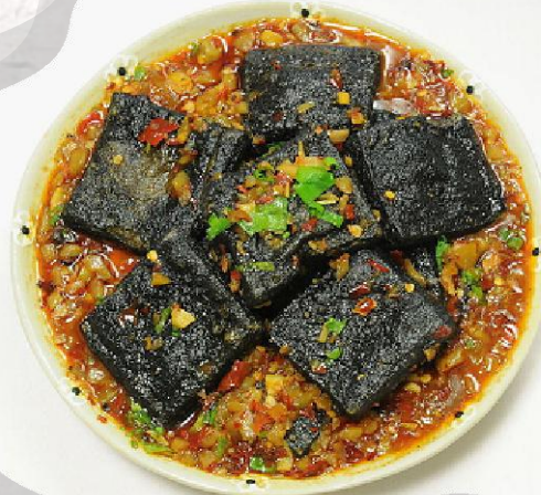
臭豆腐 (ツォードウフ)