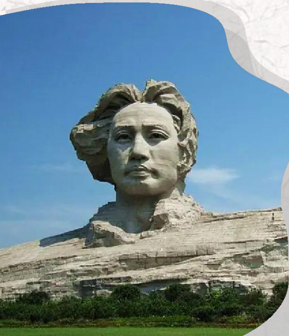
橘子洲頭 毛主席彫像

湖南省は多くの著名な歴史人物を輩出しました。後漢時代の製紙技術発明家蔡倫、明末清初の思想家・哲學家王夫之、清代末期の政治家曾國藩などがあり、中国共産党の創設者の一人で、中国の近代史において最も影響力のある人物の一人です。また、劉少奇や彭徳懷など、その他の著名な政治家や軍人も湖南省出身です。また、戦国時代の楚国出身の偉大なロマン主義詩人屈原が入水自殺した場所は、湖南省に位置する汨羅江でした。