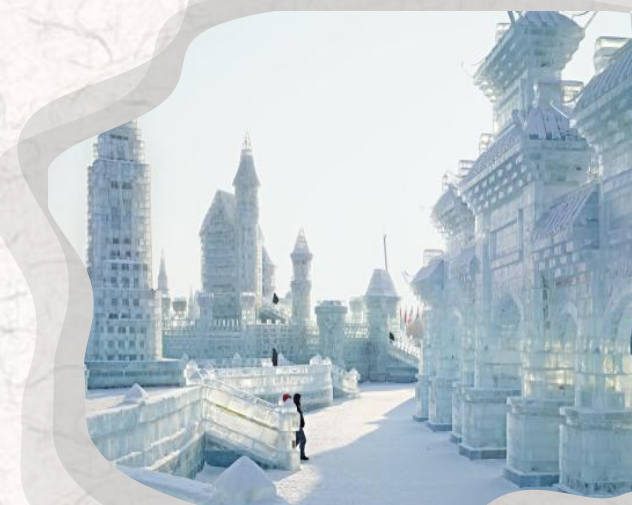
ハルビン市・冰雪大世界