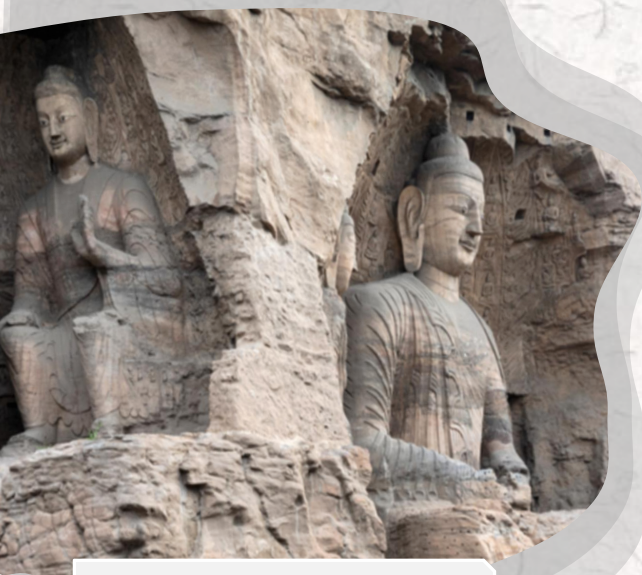
江西省・雲崗石窟

2024年にリリースされた中国のゲーム「黒神話：悟空」は、世界中で大ヒットし、有名ゲームプラットフォームでの同時接続人数がピーク時には世界2位を記録しました。江西省はこのゲームの「ロケ地」としても注目を集めていました。江西省の略称は晋で、中国春秋時代には晋の領域でした。世界文化遺産に登録されている中国三大石窟の一つである「雲崗石窟」や中国四大仏教名山の一つ「五台山」など、豊富な歴史や文化遺産で有名です。また、断崖の途中にぶら下がるように建てられた寺院「懸空寺」は2010年には米誌タイムの「世界で最も危険な建物トップ10」に選ばれ、外国人観光客が絶えません。